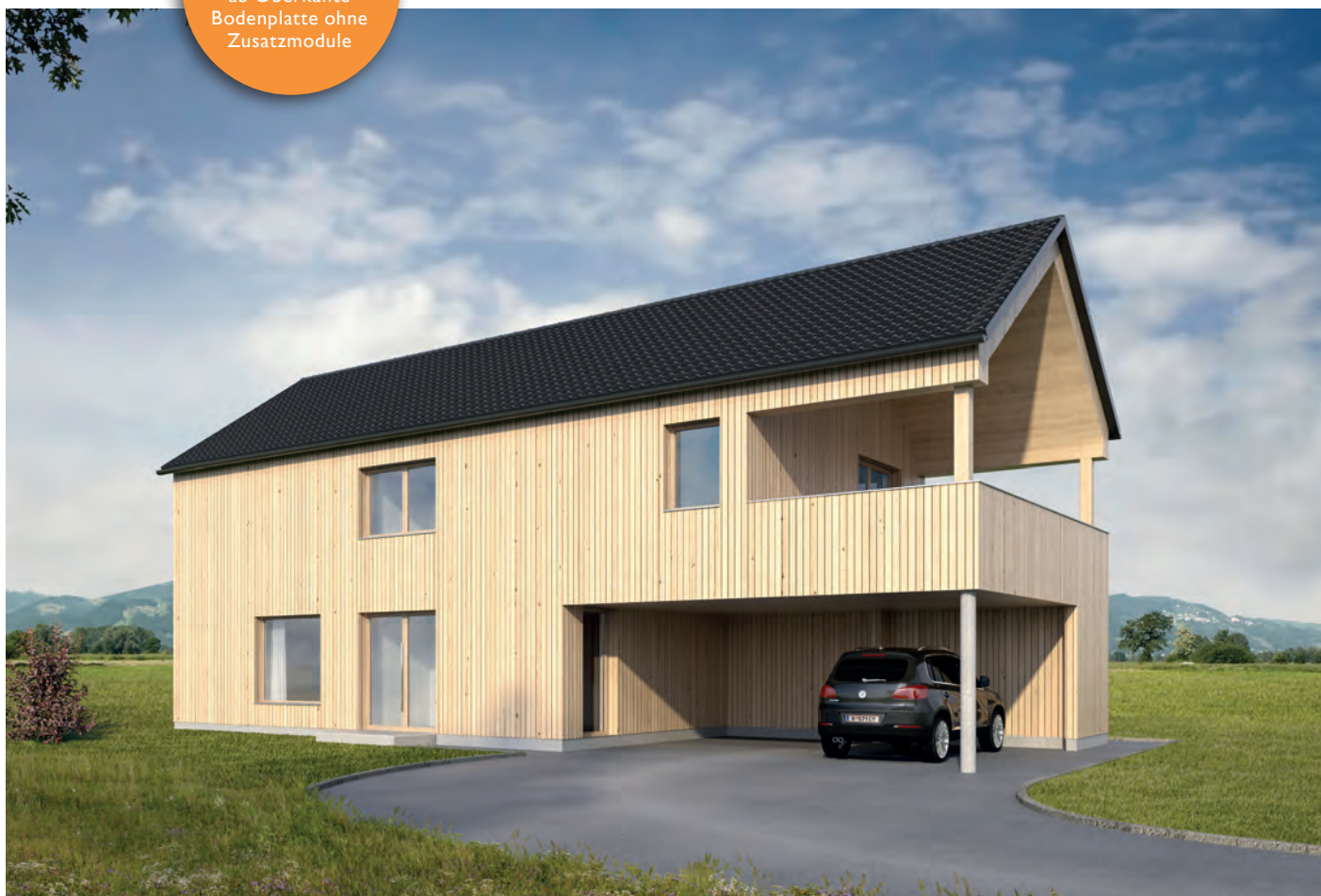
Abbildung mit Zusatzmodul 1 PKW + 1 Terrasse